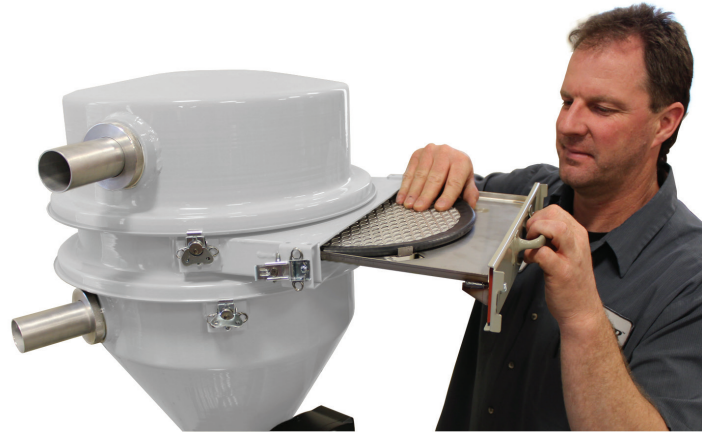
Modelo FD-15 Gaveta de filtro en una recibidora DL-15

Este módulo adicional se coloca entre la tapa y el cuerpo de los receptores ConairDuraLoad y brinda fácil acceso al filtro de pantalla, sin necesidad de quitar la tapa. Las abrazaderas giratorias que no requieren herramientas mantienen el cajón en su lugar, una vez liberados, permiten que el cajón se deslice hacia afuera, exponiendo el disco de malla anidado en la base del cajón. Una vez revisada, limpiada o reemplazada, la pantalla puede volver a deslizarse fácilmente a su posición sobre el cuerpo del cargador y sujetarse herméticamente.