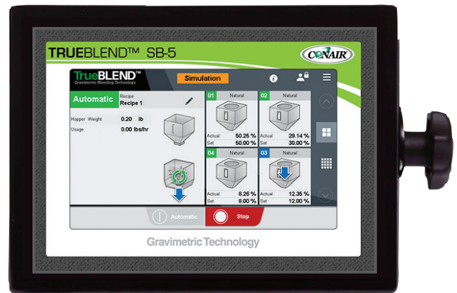
Control TrueBlend SB-5

Durante las últimas dos décadas, el control SmartBlend ha mejorado drásticamente. El control SB-5 es muy superior a sus antecesores. No solo es mucho más confiable, el SB-5 puede almacenar hasta 3,000 recetas y 4,000 materiales, haciendo que los procesos de cambio sean rápidos y simples.